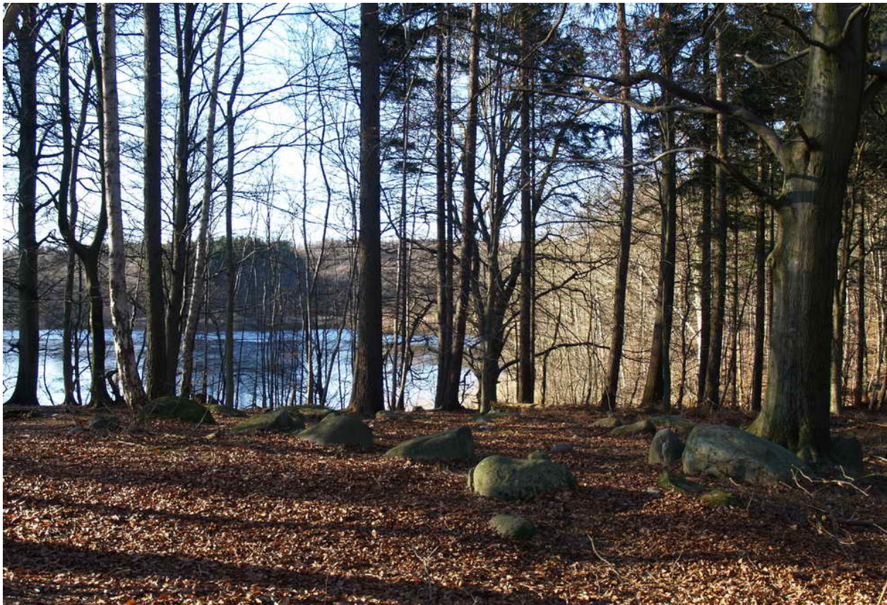
Sten, stensætning fra oldtiden 8 x 8 m med udsigt til Aunsø. Runddysse uden kammer fra 3.500 f.kr.

Fredningsnummer 3326-43 Sognebeskrivelse 020613-10